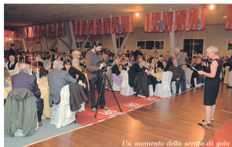
Un momento della serata di gala

nell'emettere Bot, persino nell'invitare intellettuali e studiosi. Così l'Italia scivola fuori dall'Europa, diventa un paese che si chiude. Un paese che non va bene per i nostri giovani. Solo sostenendo la domanda interna si potrebbe porre un rimedio, lo hanno fatto in Francia, in Inghilterra, in Germania, non lo si fa in Italia. Sono questi i motivi per cui non potremo stare ancora fermi, per cui organizzeremo presidi, manifestazioni, una grande iniziativa sul mezzogiorno, sul fisco e sui redditi proprio a partire dal reddito dei pensionati. Sono queste le battaglie, i temi di mobilitazione che proporrò a Cisl e Uil, se non accetteranno noi faremo comunque la nostra parte. Se anche noi rimanessimo totalmente fermi, passivi qualcuno domani potrebbe dirci: 'che cosa