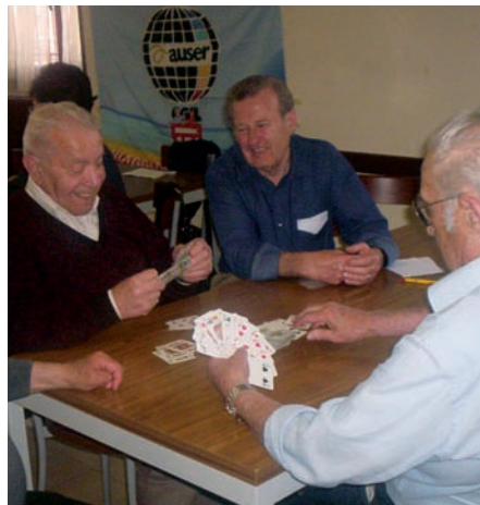
Partita a briscola in un centro anziani a Varese.

Il percorso di questo processo di inclusione sociale sarà graduale e monitorato periodicamente, la prima tappa saranno i Giochi di Liberetà , che si svolgeranno a Bormio dal 15 al 18 Settembre, con