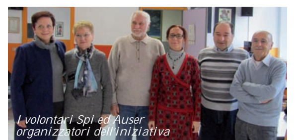
I volontari Spi ed Auser organizzatori dell'iniziativa

Memore del famoso caffè sospeso 'O ccafé suspes , un'abitudine un tempo viva nella tradizione sociale napoletana, oggi rinverditata dagli scritti di Luciano De Crescenzo e di Riccardo Pazzaglia, lo Spi di Olginate con i servizi sociali del Comune, l'Auser e una pizzeria del territorio hanno dato il via all'iniziativa Pizza sospesa . Pensata per le famiglie in difficoltà vuole coinvolgere prima di tutto gli olginatesi, ha l'obiettivo di creare solidarietà permettendo alle famiglie allargate e agli anziani in difficoltà di avere buoni pizza gratuiti. Come? All'acquisto di una pizza presso il ristorante Pizza Mania il cliente potrà lasciare una piccola mancia: ogni settimana un volontario Auser, insieme al pizzaiolo, conterà la cifra raccolta che sarà convertita in buoni pizza distribuiti poi dal Comune di Olginate – Settore Servizi sociali. In questo modo l'acquisto di una pizza permetterà di 'impastarne' un'altra. Lo Spi Cgil Val San Martino-Olginate, ha messo a disposizione una piccola somma per avviare l'iniziativa. ■