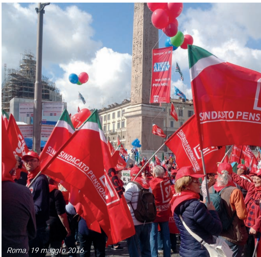
Roma, 19 maggio 2016

Occorre saper riconoscere i lavori, anche quelli non contemplati nell'abecedario del '900. Dobbiamo accettare la sfida dell'industria 4.0 e nel contempo riuscire a mettere