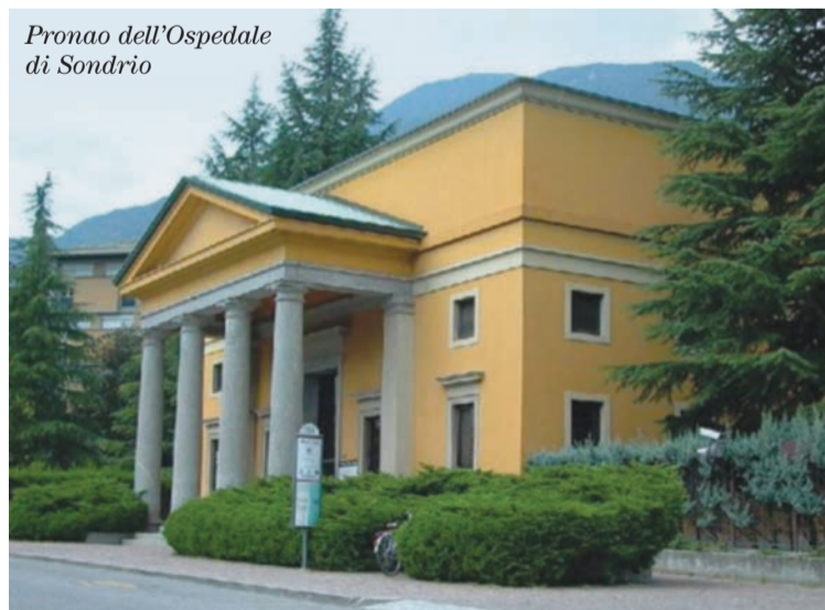
Pronao dell'Ospedale di Sondrio

Como, e gli specialisti sono oggi costretti a sobbarcarsi continue trasferte da Sondrio, mentre i medici che