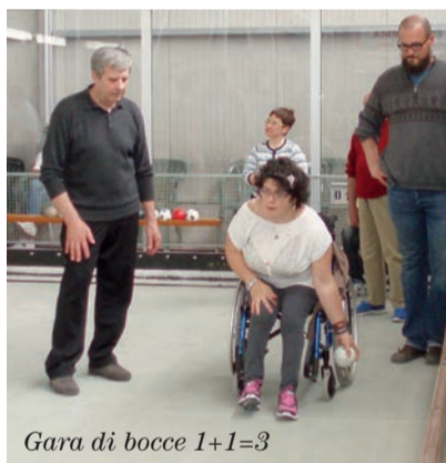
Gara di bocce 1+1=3

con la cittadina adriatica. Ma prima incontreremo gli albergatori, coloro che ogni anno ci accolgono con la loro consueta simpatia e con la gustosa cucina. Poi ci saranno la spiaggia e il mare Adriatico, meta ambita per tantissimi turisti lungo tutta l'estate e che lo Spi Cgil riesce a far mettere a disposizione, a prezzi abbordabili, ai propri iscritti. Ci saranno i giochi delle