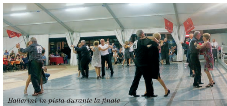
Ballerini in pista durante la finale

mane e bizantine; si potrà visitare anche Gradara e il suo borgo che, secondo il racconto di Dante Alighieri, sarebbe stato teatro della storia d'amore tragica e tormentata di Paolo e Francesca. Gradara che quest'anno è stato incoronato borgo dei borghi ; poi ancora si potrà andare a Mondaino e gustare il famoso formaggio di fossa; ci sarà l'opportunità di visitare l'antica mariniera di Cattolica e chissà cos'altro ancora. Infine, come ogni anno, la cena di gala con pesce alla griglia preparato al momento dai soci della cooperativa pescatori. I partecipanti alle precedenti edizioni sanno che i Giochi non sono solo divertimento e svago, cosa da non buttare via considerando che stiamo parlando di persone che hanno lavorato una vita e che se cercano di pas-