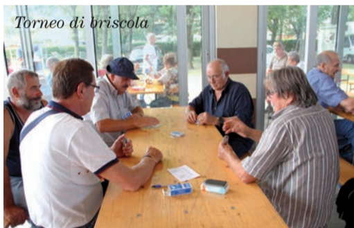
Torneo di briscola

sare una settimana serena ne hanno tutto il diritto. Tutti sanno che ai Giochi si discute di politica e di sindacato, perciò come negli scorsi anni il convegno che terremo al teatro della Regina vedrà la partecipazione di importanti politici e di responsabili del sindacato a livello nazionale e regionale. Questo è il programma ai ventiquattresimi Giochi di LiberEtà di Cattolica che lo Spi Cgil Lombardia vi propone per il prossimo settembre. Finiti questi si rientra e, forse, non troveremo il tempo per provare nostalgia, infatti riprenderemo instancabilmente il nostro lavoro... e quest'anno a testa bassa! Ci attendono il congresso e le assemblee delle leghe per discutere le strategie dello Spi e della Cgil e predisporre il programma per i prossimi quattro anni. Ecco ve lo abbiamo detto! ■