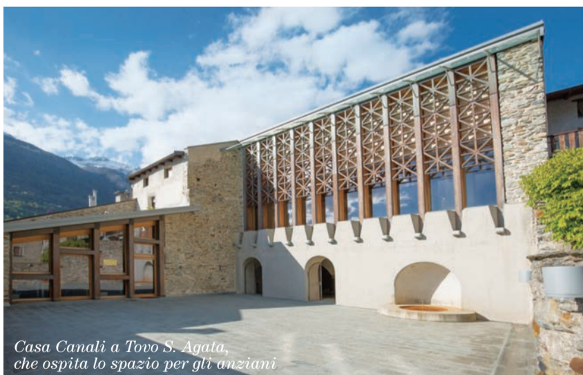
Casa Canali a Tovo S. Agata, che ospita lo spazio per gli anziani

Sbrighes , in dialetto, è un termine che significa sbrigati, datti una mossa, che bene riassume lo spirito che anima questo progetto, avviato nei mesi scorsi, che si propone di arrestare il disinvestimento e il graduale abbandono, fisico e relazionale, delle persone verso il territorio, nel caso specifico quello della zona di Tirano. Finanziato dal bando Welfare in Azione di Fondazione Cariplo e promosso dalla Cooperativa Sociale Ippogrifo, dalla Comunità Montana Valtellina di Tirano, dal Comune di Tirano e dalle Cooperative Sociali Ardesia e Intrecci il progetto Sbrighes! vuole “trasformare la comunità in un posto vivo, attivo dove poter costruire il proprio futuro e quello degli altri.” Un obiettivo certamente ambizioso,