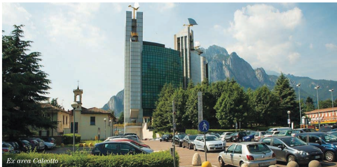
Ex area Caleotto