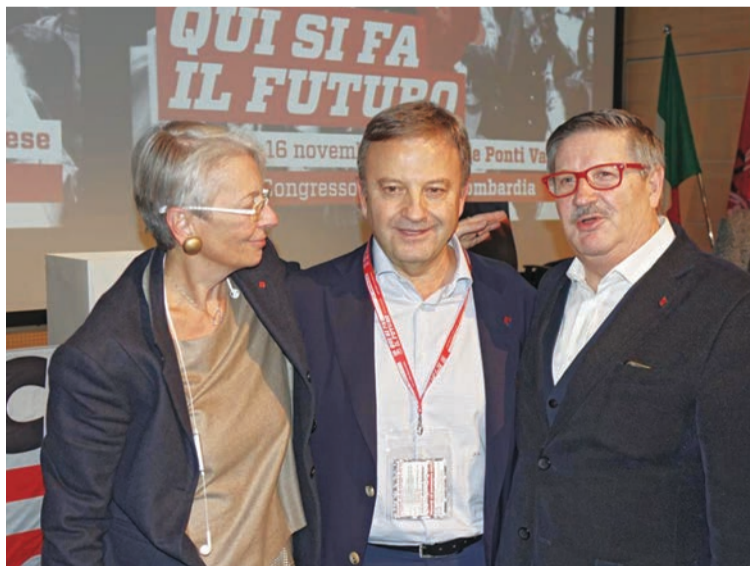
Al termine dei lavori congressuali la neoletta assemblea generale dello Spi Lombardia è stata convocata per eleggere il segretario generale. Stefano Landini è stato riconfermato alla guida del sindacato lombardo dei pensionati. Nella foto lo vediamo tra Elena Lattuada, segretaria generale Cgil Lombardia e Ivan Pedretti, segretario generale Spi nazionale

Le misure che sta prendendo il governo Lega-Cinque