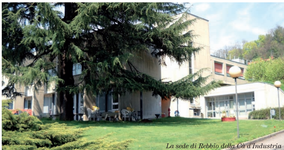
La sede di Rebbio della Ca' d'Industria

l'assistenza domiciliare e tutti gli interventi, anche piccoli, utili a ritardare il momento del ricovero. Nella sola città di Como 10.321 abitanti hanno più di 75 anni e il 60% di loro non ha o non ha più un partner; basta questo per dire della solitudine e del disagio di molti. È più o meno così in tutta Italia, perché abbiamo la fortuna di vivere sempre più a lungo; perciò l'intervento su Rsa e assistenza domiciliare deve diventare un impegno prioritario per tutte le istituzioni. Per questo obiettivo il sindacato continuerà a battersi, come pure contro l'aumento delle rette delle Rsa, che stanno diventando insostenibili per molti. ■