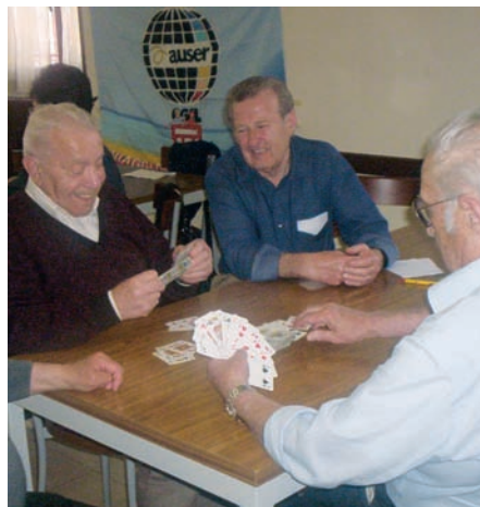
Partita a briscola in un centro anziani a Varese.

Non solo pensionati e anziani. Il progetto Coesione sociale - creato dall'Area benessere dello Spi e Ausser Lombardia - cresce e amplia la sua sfera d'azione. Dopo una prima fase in cui si è iniziato a coinvolgere chi frequenta i centri anziani, gli ospiti delle case di riposo, adesso sta collaborando con le associazioni Anffas , la Le-dha e la Special Olympics lombarde per coinvolgere giovani con disabilità intellettiva. Il percorso di questo processo di inclusione sociale sarà graduale e monitorato periodicamente, la prima tappa saranno i Giochi di Liberetà , che si svolgeranno a Bormio dal 15 al 18 Settembre, con