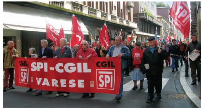
Anche lo Spi di Varese ha partecipato il 4 aprile alla grande manifestazione nazionale della Cgil a Roma.