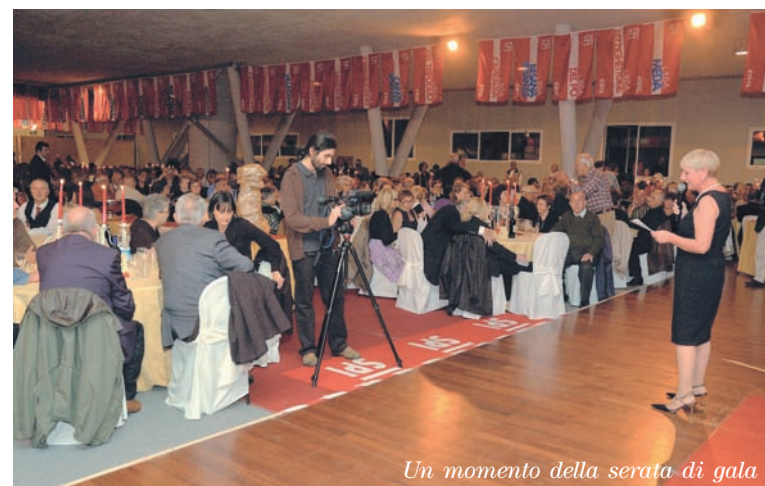
Un momento della serata di gala

nell’emettere Bot, persino nell’invitare intellettuali e studiosi. Così l’Italia scivola fuori dall’Europa, diventa un paese che si chiude. Un paese che non va bene per i nostri giovani. Solo sostenendo la domanda interna si potrebbe porre un rimedio, lo hanno fatto in Francia, in Inghilterra, in Germania, non lo si fa in Italia. Sono questi i motivi per cui non potremo stare ancora fermi, per cui organizzeremo presidi, manifestazioni, una grande iniziativa sul mezzogiorno, sul fisco e sui redditi proprio a partire dal reddito dei pensionati. Sono queste le battaglie, i temi di mobilitazione che proporrò a Cisl e Uil, se non accetteranno noi faremo comunque la nostra parte. Se anche noi rimanessimo totalmente fermi, passivi qualcuno domani potrebbe dirci: ‘che cosa