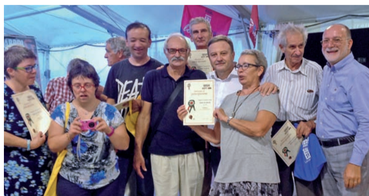
Alcuni componenti della delegazione bergamasca insieme al segretario generale dello Spi Lombardia Stefano Landini nella giornata conclusiva dei Giochi regionali di Cattolica

Uscendo dalle valli, mostre di pittura si sono svolte a Bergamo e a Calusco d'Adda e sempre a Bergamo è stata allestita anche un'esposizione fotografica, mentre al Centro anziani di Pontirolo si è tenuta una gara di briscola. Come è tradizione da sempre, i Giochi si chiudono con le finali regionali. Abbandonata momentaneamente la montagna, per il secondo anno l'appuntamento per parteci-