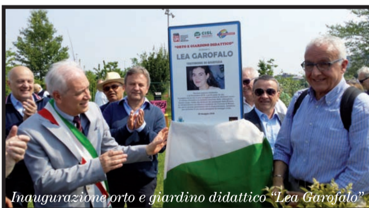
Inaugurazione orto e giardino didattico "Lea Garofalo"