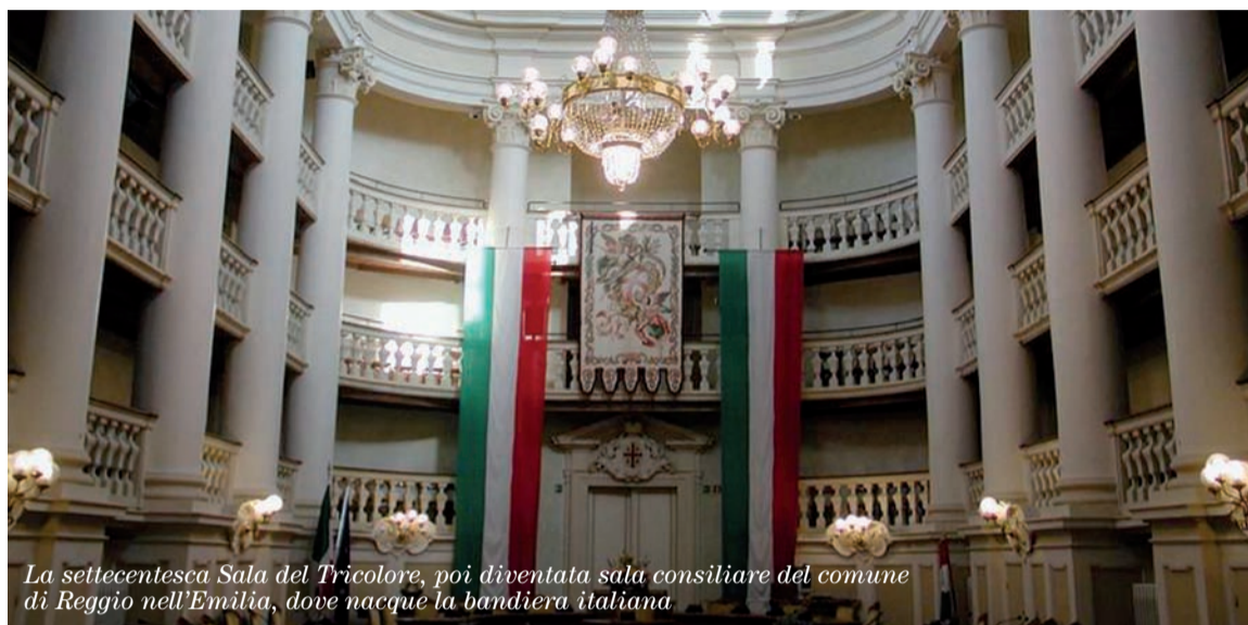
La settecentesca Sala del Tricolore, poi diventata sala consiliare del comune di Reggio nell'Emilia, dove nacque la bandiera italiana

Fece la proposta di adottare il tricolore come bandiera della Repubblica il suo segretario generale, Giuseppe Compagnoni , chiamato per questo padre del Tricolore . Compagnoni era un ex prete che aveva gettato la veste talare per protesta contro i metodi usati dallo Stato della Chiesa nei confronti dei detenuti e aveva sposato gli ideali della Rivoluzione Francese. La Bandiera fu adottata il 7 Gennaio 1797. È per questo che, il 7 gennaio, è stato proclamato Giornata del tricolore .