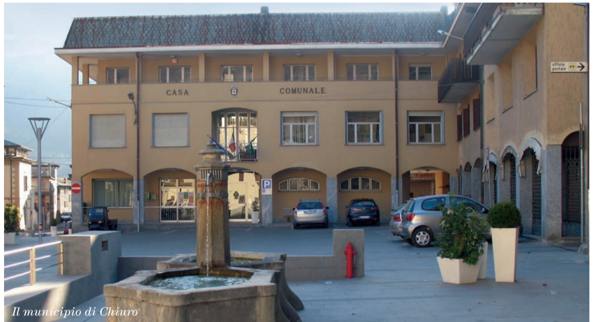
Il municipio di Chiuro

È necessario affrontare questo tema di per sé: non credo che ci sia nessun valtellino convinto fino in fondo che, in un territorio di 180 mila abitanti, come il nostro, possano continuare ad esserci, in un clima di ristrettezze economiche, una amministrazione provinciale (che diventerà area vasta), 5 Comunità Montane e 77 Comuni. Chi ancora crede che ciò sia possibile è bene che sappia che, in Parlamento, è stato presentato, dal Partito Democratico, una proposta di Legge che prevede la fusione obbligatoria dei Comuni che abbiano meno di 5000 abitanti. Messa così la cosa non ci piace perché la montagna ha le sue esigenze e le sue specificità, ma allora è bene che si sappia una cosa: o