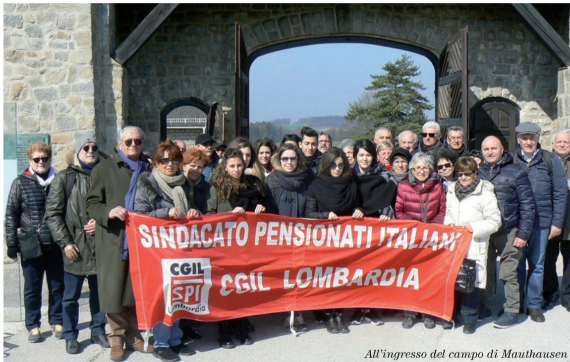
All'ingresso del campo di Mauthausen