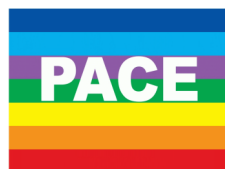
Tavola della pace di Bergamo Rete della pace