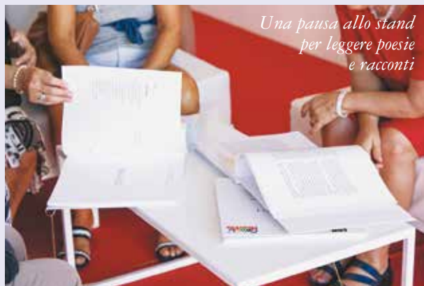
Una pausa allo stand per leggere poesie e racconti