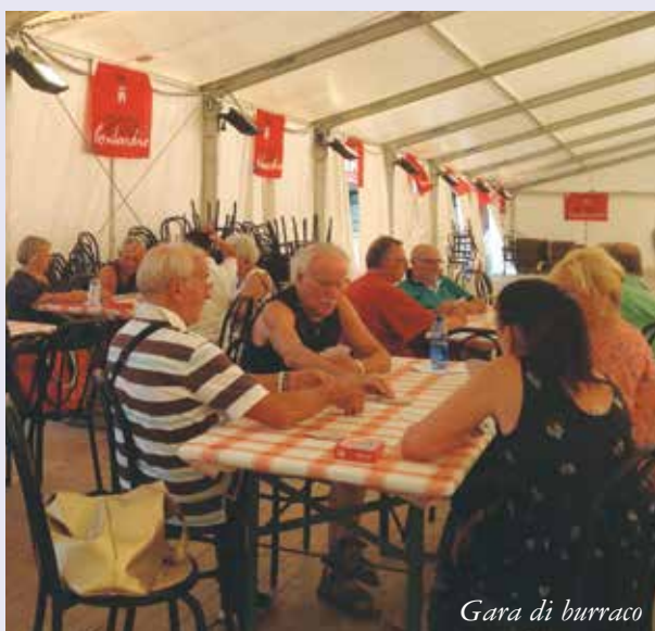
Gara di burraco