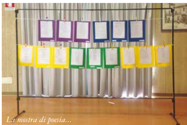
La mostra di poesia...