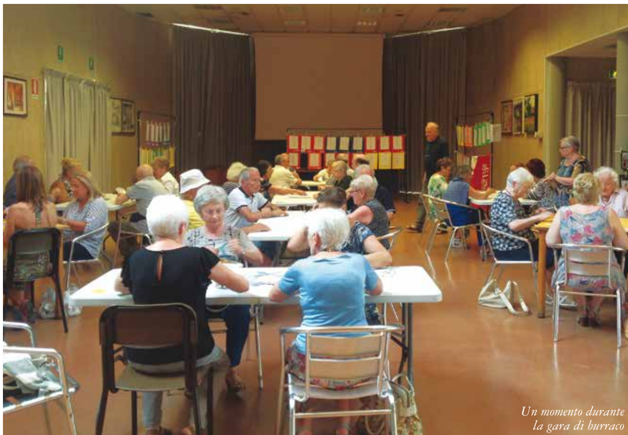
Un momento durante la gara di burraco