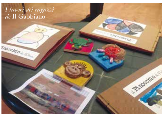
I lavori dei ragazzi de Il Gabbiano