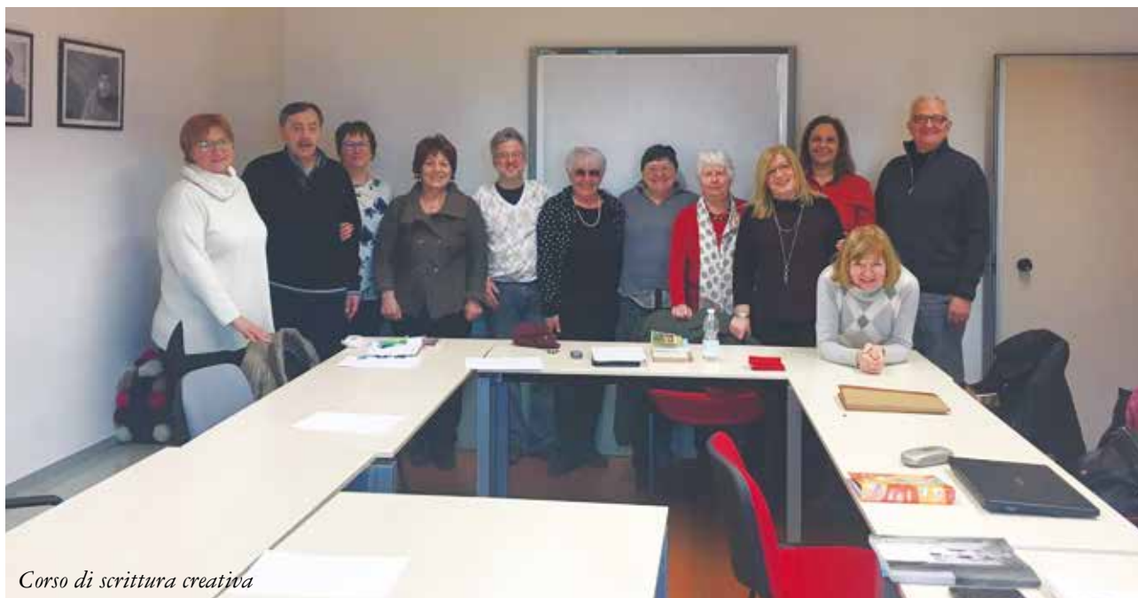
Corso di scrittura creativa

Esperimenti: dieci incontri di due ore ciascuno, a cadenza settimanale, che prevedono espe-