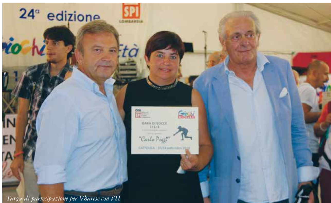
Targa di partecipazione per Vbarese con l'H

Una gara di aquiloni sulla spiaggia o una rap-