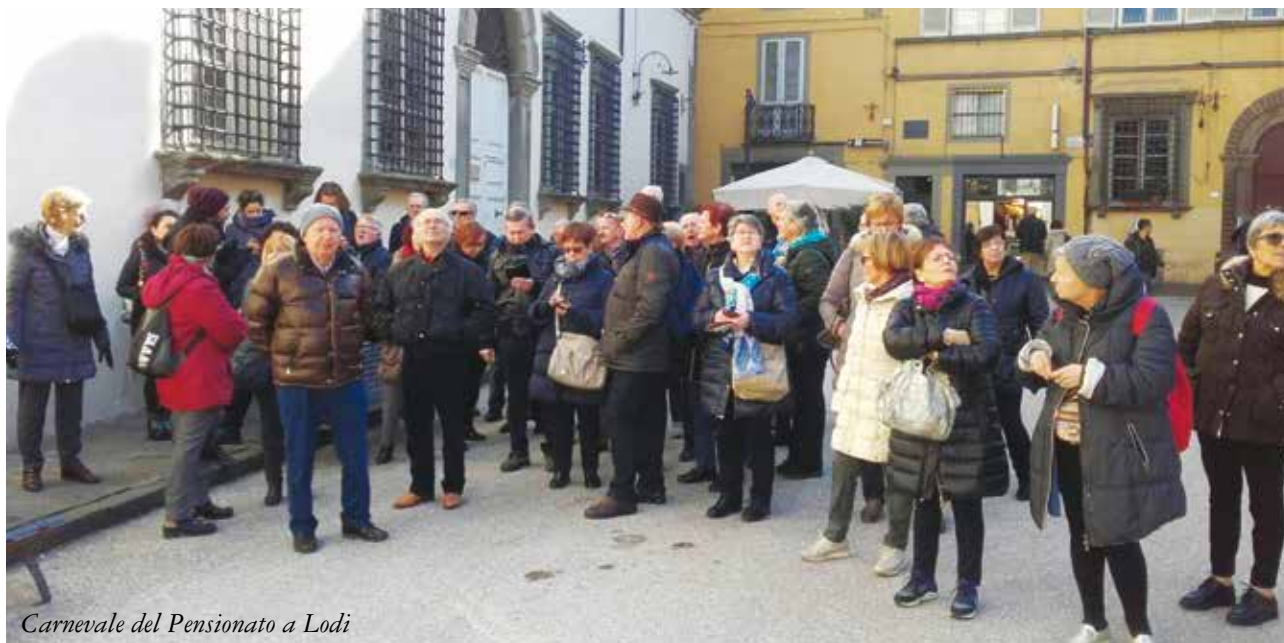
Carnevale del Pensionato a Lodi