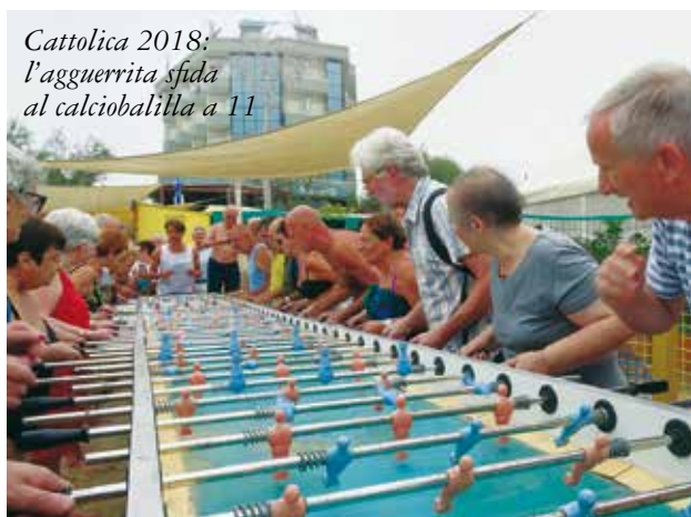
Cattolica 2018: l'agguerrita sfida al calciobalilla a 11

zato camminate e escursioni. Poi siamo stati di supporto a molte iniziative organizzate da altri – comuni, associazioni sportive e culturali. Non mi dilungo per non tediare ma lo Spi e i suoi pensionati in questa nostra regione sono veramente la spina dorsale della socialità, oltre che dell'attività confederale della Cgil.