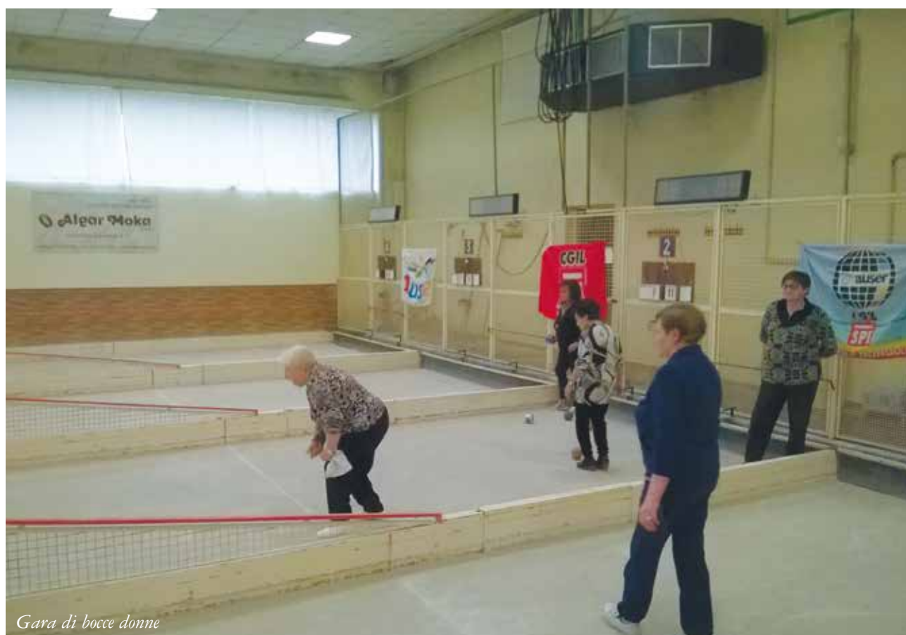
Gara di bocce donne