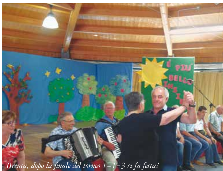
Brenta, dopo la finale del torneo 1+1=3 si fa festa!

rese, non solo per il lavoro dei volontari dello Spi, ma anche per le risorse economiche che vengono stanziare: “per questo è importante la fase della sindacalizzazione. In tutte le nostre iniziative privilegiamo gli iscritti ma abbiamo un occhio attento anche ai non iscritti, utilizziamo le iniziative per avere nuovi contatti con le persone e il territorio.