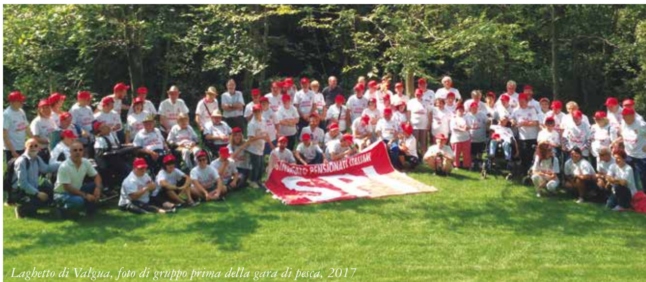
Laghetto di Valgua, foto di gruppo prima della gara di pesca, 2017