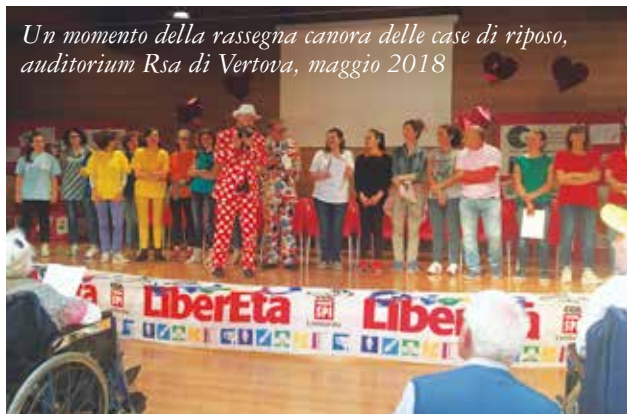
Un momento della rassegna canora delle case di riposo, auditorium Rsa di Vertova, maggio 2018

co che precedentemente ricoprivo in Fp, dove seguivo i lavoratori delle Rsa. Il problema vero è stato e resta quello del coinvolgimento delle leghe, necessario per dare una sempre maggiore visibilità allo Spi. Basti pensare che oggi laddove la nostra presenza è maggiormente consolidata alle iniziative partecipano anche duecento persone. L'obiettivo era ed è coinvolgere e dare visibilità a chi è meno attivo. Abbiamo trasformato le classiche feste di compleanno in giochi, laboratori, mostre in modo tale che tutti potessero dar vita e corpo a capacità e abilità che ancora hanno. Questo assecondando anche le loro richieste. Un esempio: alla Rsa Carisma, dopo aver partecipato al gruppo di lettura per la selezione delle opere finaliste del Premio nazionale Liberetà, alcuni ospiti hanno avanzato la richiesta di poter iniziare loro stessi a scrivere dei racconti autobiografici. Anche questo è un modo per dare un senso e un valore alla propria esistenza, alla vita vissuta. Se ci crediamo è questa la strada da intraprendere per dare un vero futuro a questo tipo di manifestazioni”.