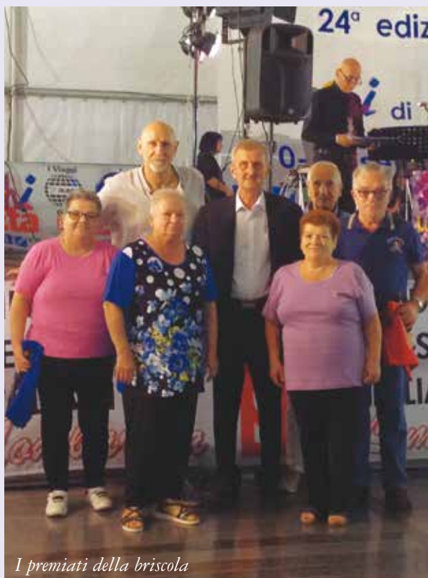
I premiati della briscola