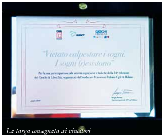
La targa consegnata ai vincitori