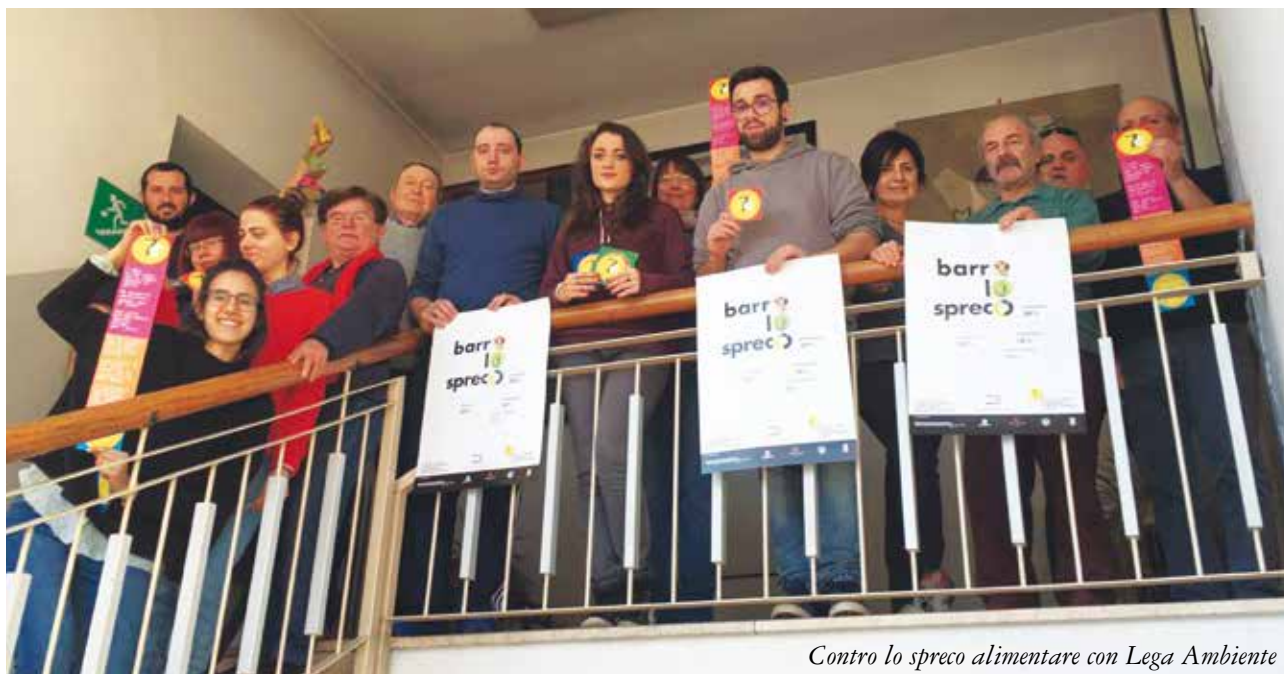
Contro lo spreco alimentare con Lega Ambiente