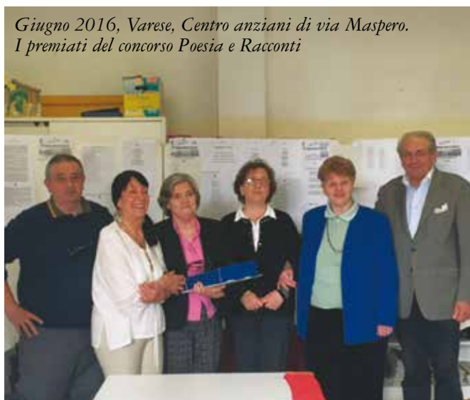
Giugno 2016, Varese, Centro anziani di via Maspero. I premiati del concorso Poesia e Racconti