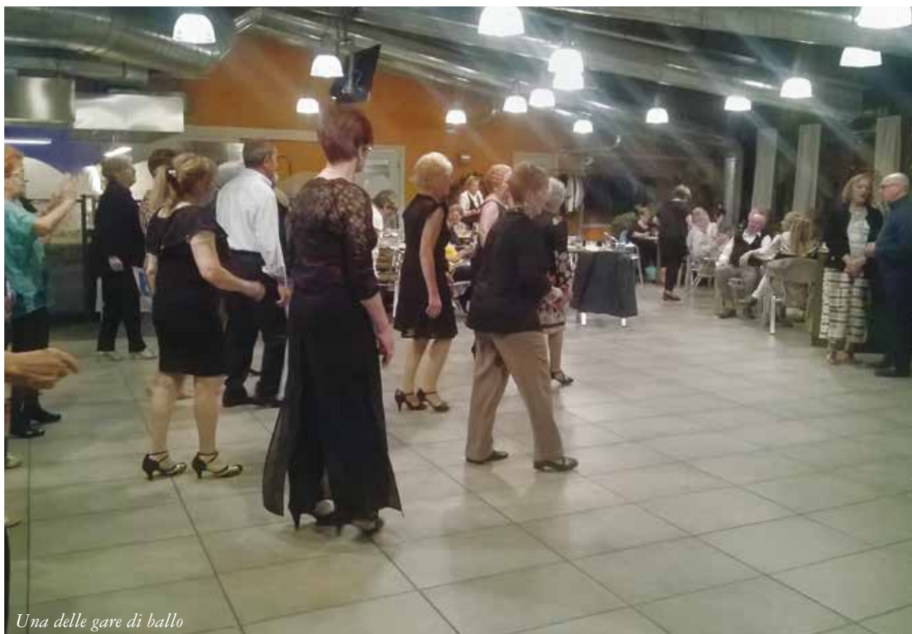
Una delle gare di ballo