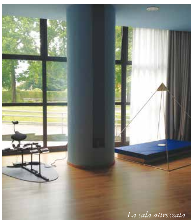
La sala attrezzata

star bene delle persone che non è, specialmente a una certa età, l'assenza di malattia ma l'equilibrio complessivo che si può raggiungere e che è molto soggettivo. Per questo abbiamo introdotto tutta una serie di attività che vanno dal Tai Chi Chuan, Hemi sync music (una meta musica che lavora sulle frequenze), alla piramide Cheope oltre alla musicoterapia, al corso sugli oli essenziali e altro. Tutto questo nell'ottica di affermare