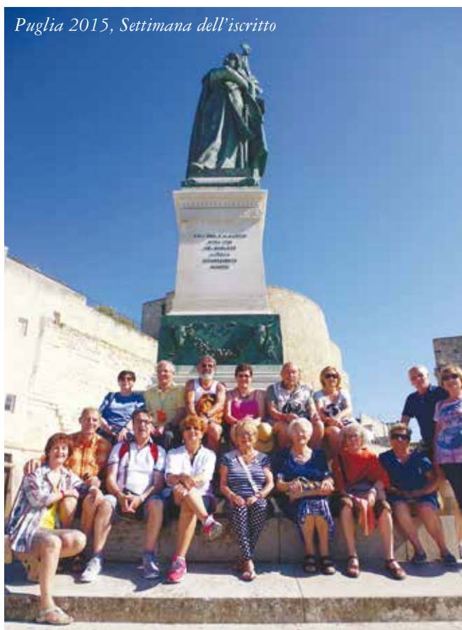
Puglia 2015, Settimana dell'iscritto

“Continuiamo poi i tradizionali tornei di Bocce Memorial Ratti, di cui siamo giunti alla 19esima edizione, tornei che abbiamo fatto rientrare nei Giochi di Liberetà. Una novità di questo 2018 è stato invece l'accordo col comune di Tuscolano Maderno per la visita alla storica cartiera. Abbiamo messo a punto tre tipologie di percorso che vanno dalla sola visita alla cartiera, all'arrivo in cartiera con un trenino locale, alla possibilità di concludere con un pranzo. Le visite sono possibili da aprile fino a ottobre. È molto interessante perché i magli sono ancora