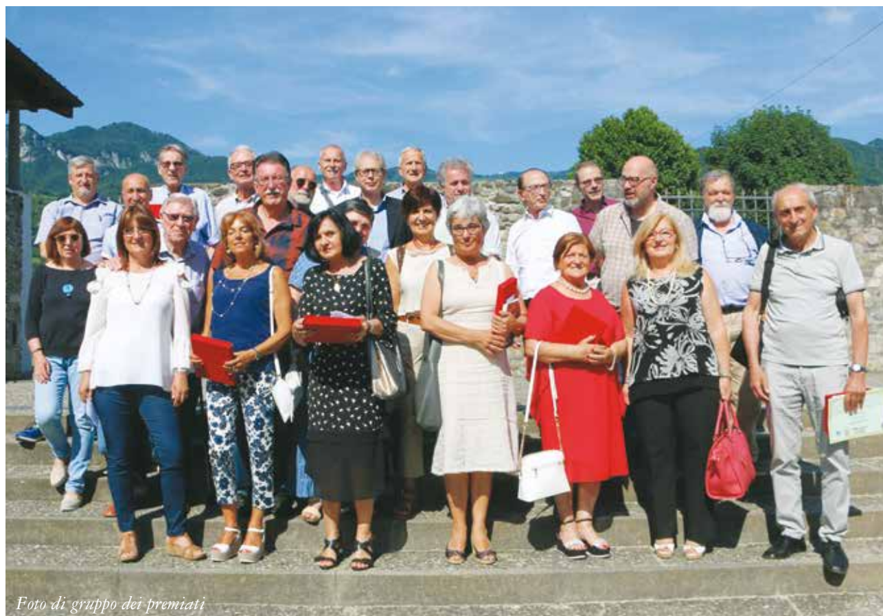
Foto di gruppo dei premiati

Circa un centinaio le persone che hanno par-