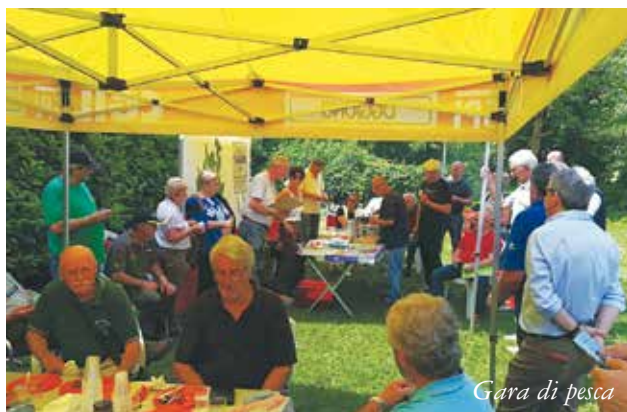
Gara di pesca

Da tempo i nostri iscritti, e non solo, si mettono in gioco coi Giochi di Liberetà all'interno dei concorsi di poesia, racconto, fotografia e pittura. Molti nostri volontari, inoltre, hanno partecipato alle varie fasi del progetto: dall'allestimento dell'esposizione, alla predisposizione