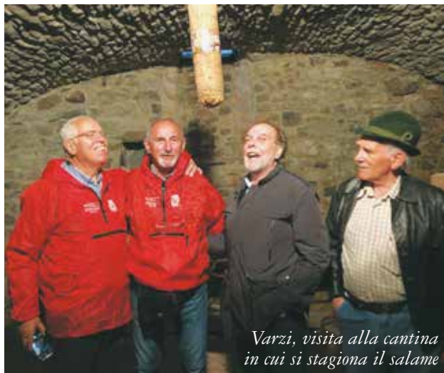
Varzi, visita alla cantina in cui si stagiona il salame

L'aumento dell'aspettativa di vita è un fatto. Solo pochi anni fa non si dava la giusta importanza alle aspettative e ai desideri di svago delle persone anziane. Si considerava l'andare in pensione un traguardo in sé e, solo in pochi, in particolare gli appartenenti ai ceti più abbienti, continuavano a coltivare interessi. Se questo in parte è quello che è successo a maggior ragione penso che sviluppare un intervento sindacale su più canali e con caratteristiche multidisciplinari non solo è giusto ma obbligatorio se si vuole che il sindacato pensionati italiano sia presente