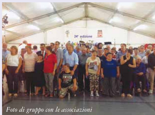
Foto di gruppo con le associazioni