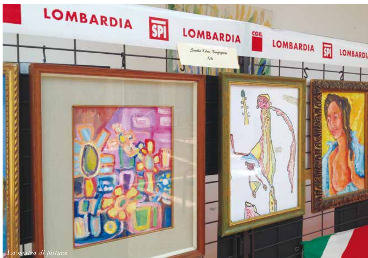
La mostra di pittura

A queste ultime hanno partecipato gli ospiti della stessa casa di riposo, quelli del centro diurno integrato e delle Opere Pie di Codogno, della casa famiglia Il sorriso di Castiglione d'Adda e quelli che oramai sono gli storici amici e partecipanti dell'istituto Bergognone di Lodi. In tantissimi hanno affollato l'ampio spazio