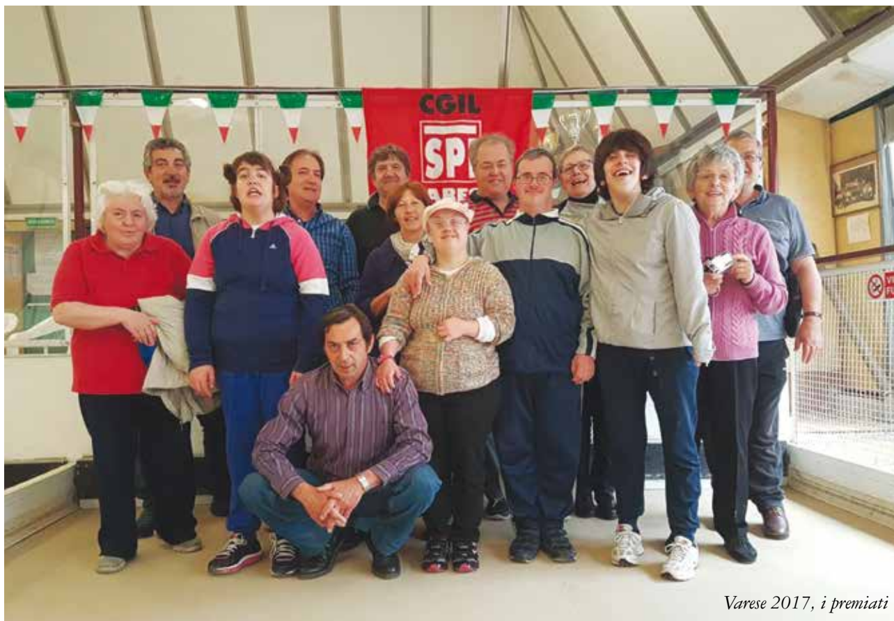
Varese 2017, i premiati