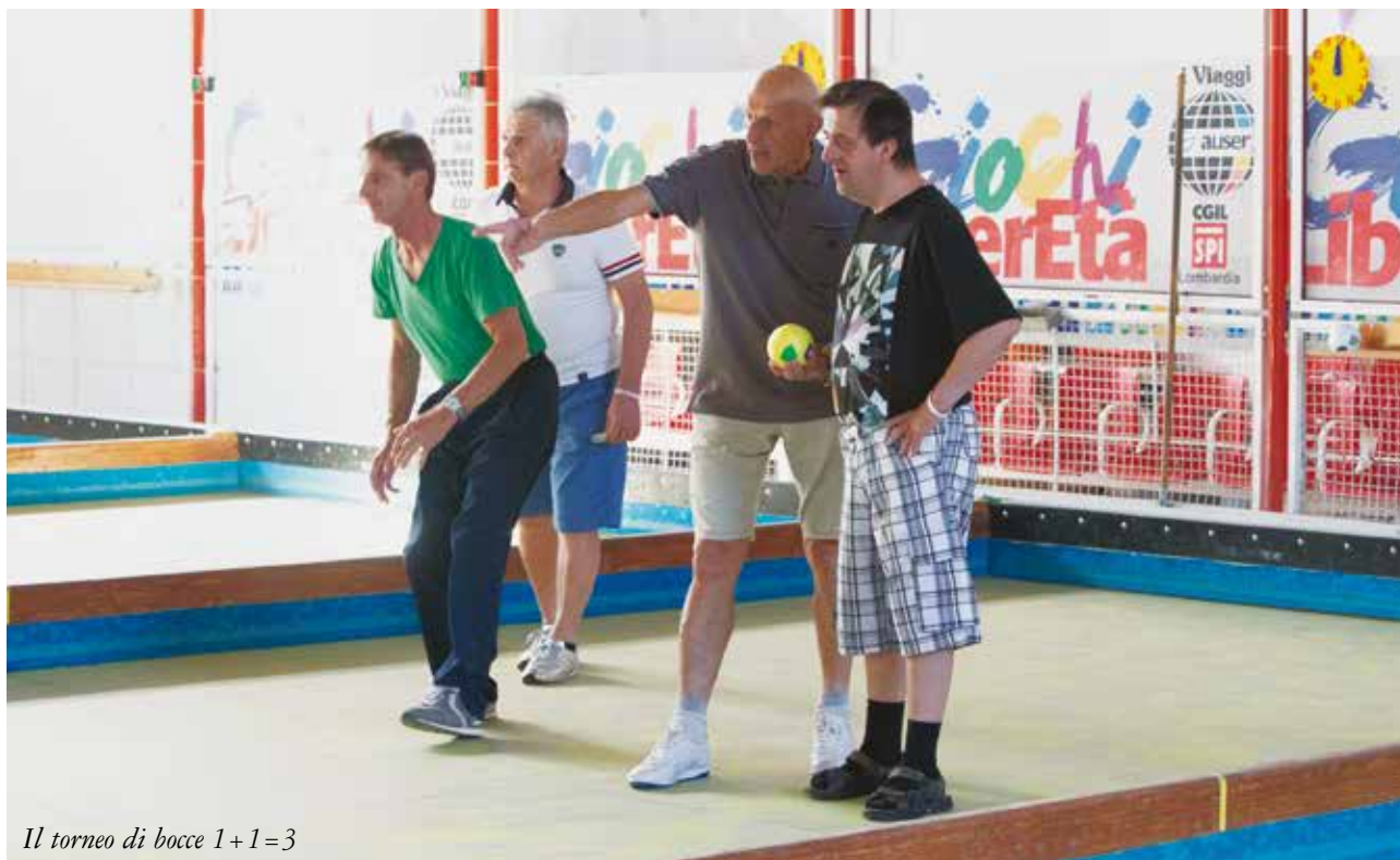
Il torneo di bocce 1+1=3

Parlare delle leggi razziali di ottant'anni fa per ragionare del presente – del razzismo che torna, dei muri e dei fili spinati che si riaffacciano nelle cronache dei telegiornali – ha permesso ai tanti che non si riconoscono in questa ondata xenofoba di riaffermare quelli che sono i valori che stanno, ancora oggi, alla base del nostro vivere, delle nostre azioni, del nostro impegno quotidiano nelle leghe, piuttosto che nelle associazioni di volontariato.