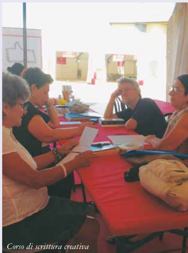
Corso di scrittura creativa