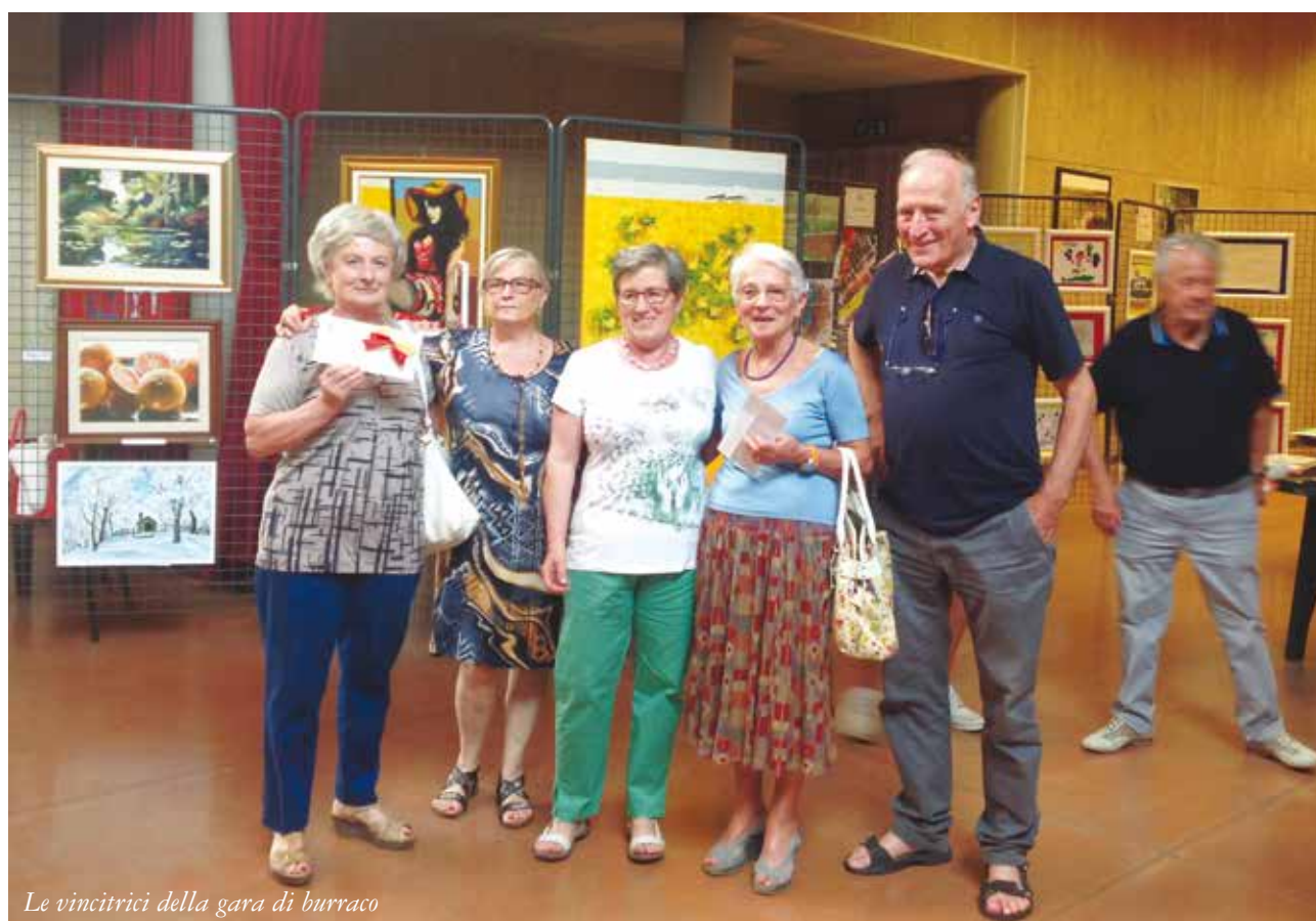
Le vincitrici della gara di burraco

All'interno delle mostre si sono potuti ammirare anche i disegni dei ragazzi di due associa-