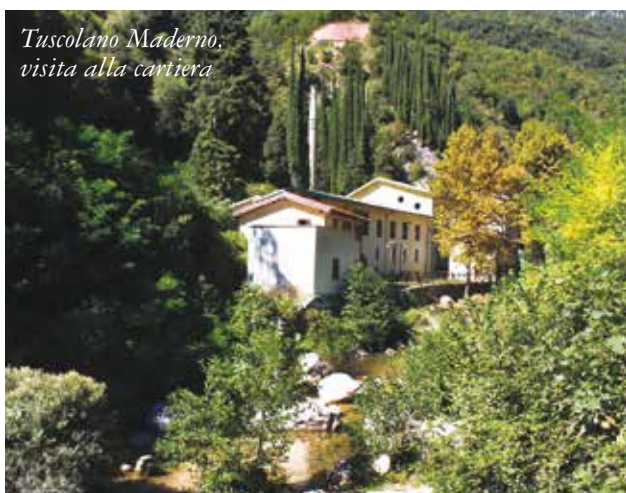
Tuscolano Maderno, visita alla cartiera

Con Brescia solidale , che gestisce la Rsa Arici Segna nel 2016 abbiamo organizzato un corso sul tema Vivere serenamente la terza età , che si è svolto sia nelle leghe Spi della città che nella sede della Rsa, l'anno successivo il tema è cambiato, al centro è stata la memoria, con una serie di incontri interattivi fra medici della Rsa e pubblico che hanno avuto un tale successo da essere ripetuti quest'anno anche con Uisp. “Sempre con Brescia solidale nel 2018 abbiamo organizzato quattro incontri dedicati al tema della prevenzione in ambito domestico e abbiamo così parlato di cadute, infortuni domestici, furti e truffe oltre che di malanni di stagione. L'anno prima invece avevamo affrontato il tema 'mal di schiena' su richiesta dei partecipanti. Un'altra iniziativa è stata quella organizzata presso la