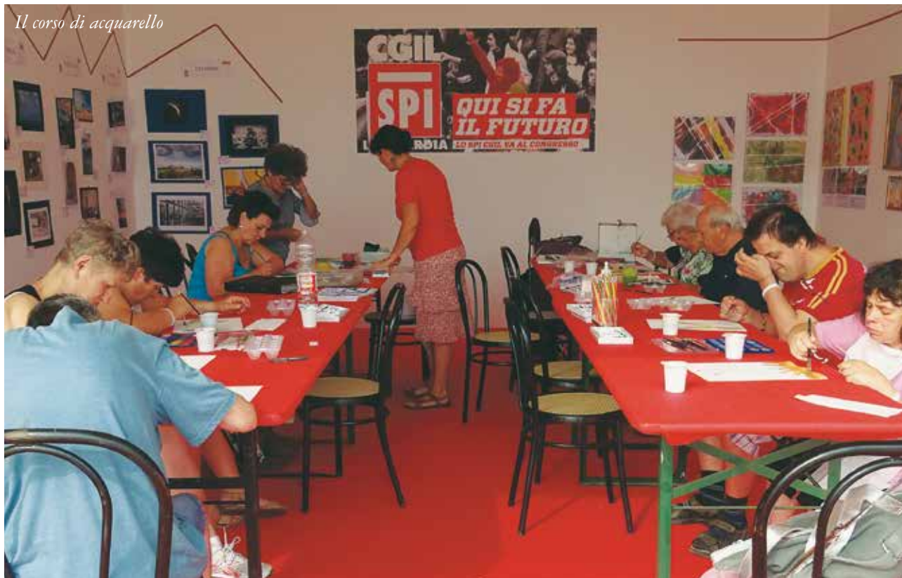
Il corso di acquarello