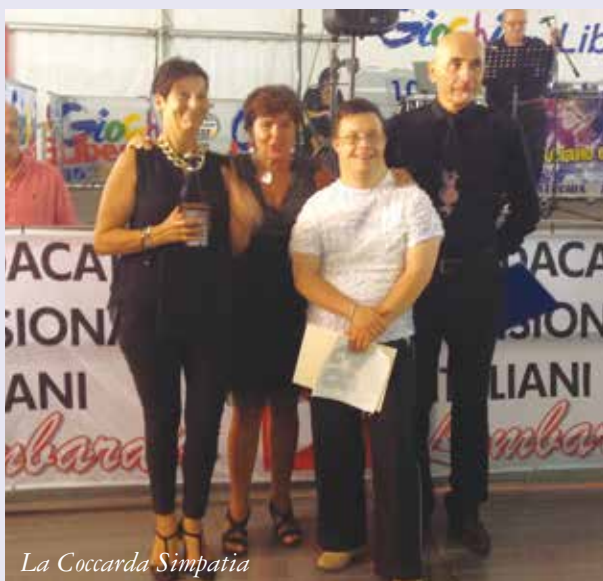
La Coccarda Simpatia