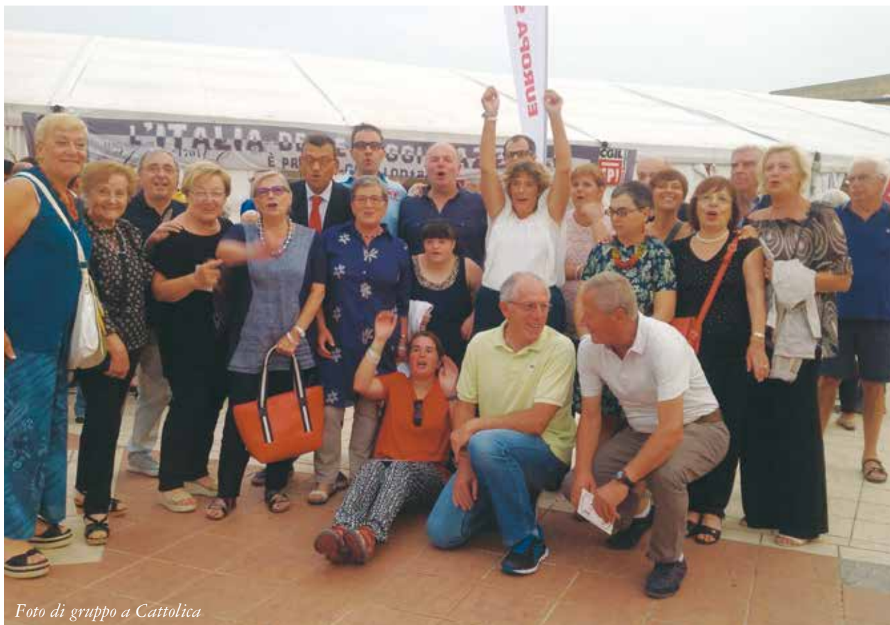
Foto di gruppo a Cattolica