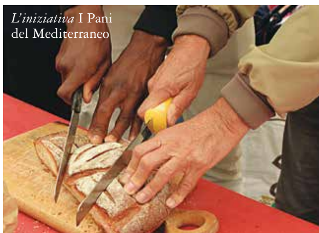
L'iniziativa I Pani del Mediterraneo

rienze interattive volte a migliorare le capacità cognitive, in particolare di memorizzazione.