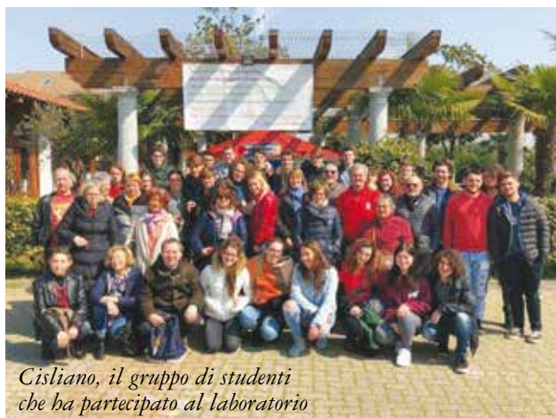
Cislano, il gruppo di studenti che ha partecipato al laboratorio