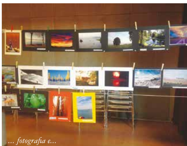
... fotografia e...