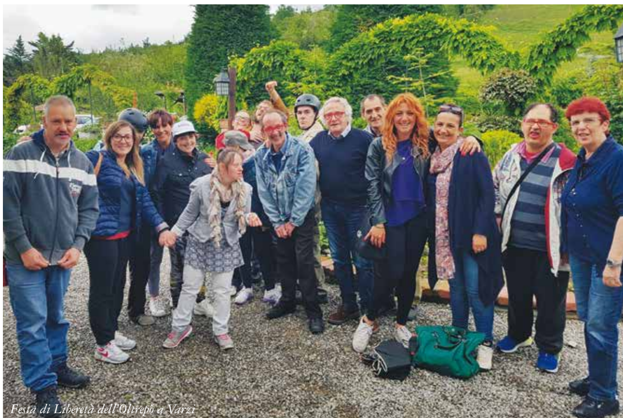
Festa di Liberet  dell'Oltrep  a Varzi

lo Spi di Pavia. Sempre di più nell'attuale società la necessità di meglio adeguare il sindacato pensionati della Cgil ai bisogni espressi dagli anziani e dai pensionati diventata dirimente. Tra questi bisogni non sono da meno lo stare insieme, il coltivare le proprie passioni – che spesso sono state trascurate per molteplici motivi negli anni dell'attività lavorativa e che ritornano quasi sempre alla ribalta appena questa