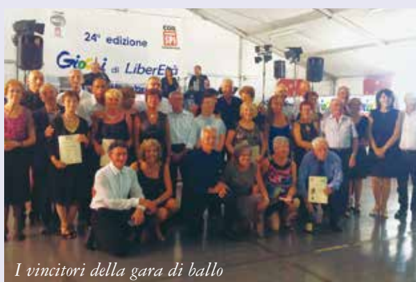
I vincitori della gara di ballo