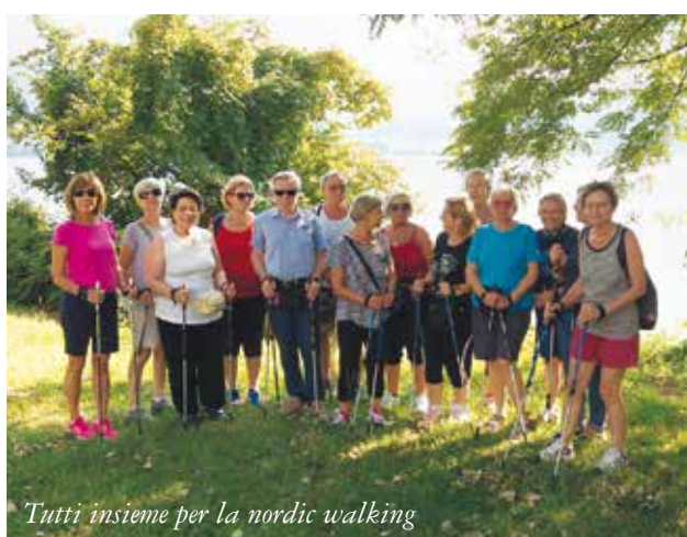
Tutti insieme per la nordic walking

ogni anno, circa seicento persone. La gita si propone dalla domenica al venerdì successivo nella settimana di Carnevale e coinvolge tutti i territori della provincia. Dall'anno scorso si è aggiunta una seconda proposta che prevede un soggiorno di due giorni sempre in occasione del Carnevale. Lo scorso anno Ferrara e carnevale di Cento, quest'anno Arezzo e carnevale di Viareggio.