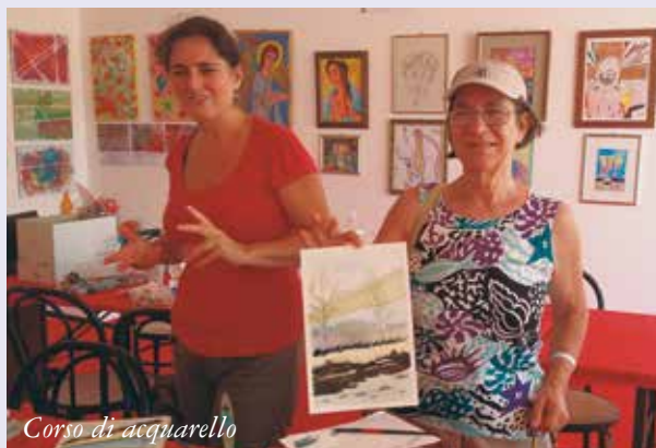
Corso di acquarello