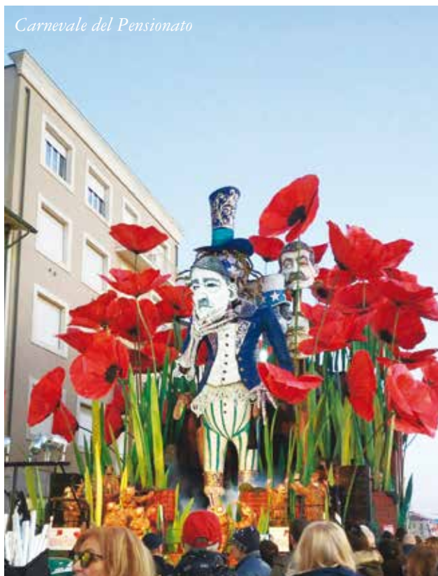
Carnevale del Pensionato

c'è chi meglio si esprime dietro uno sportello e chi, invece, preferisce organizzare eventi e partecipare direttamente alla vita sociale di un territorio. In questa ottica si colloca la progettualità dell'area benessere, che comprende diverse attività, alcune storiche altre introdotte da poco. Una proposta caratteristica dello Spi di Lecco è il Carnevale del Pensionato che prevede la visita a una città d'arte, un pranzo in compagnia e un pomeriggio danzante. Negli ultimi anni si è realizzato a Bergamo, Mantova e Lodi e ha coinvolto,