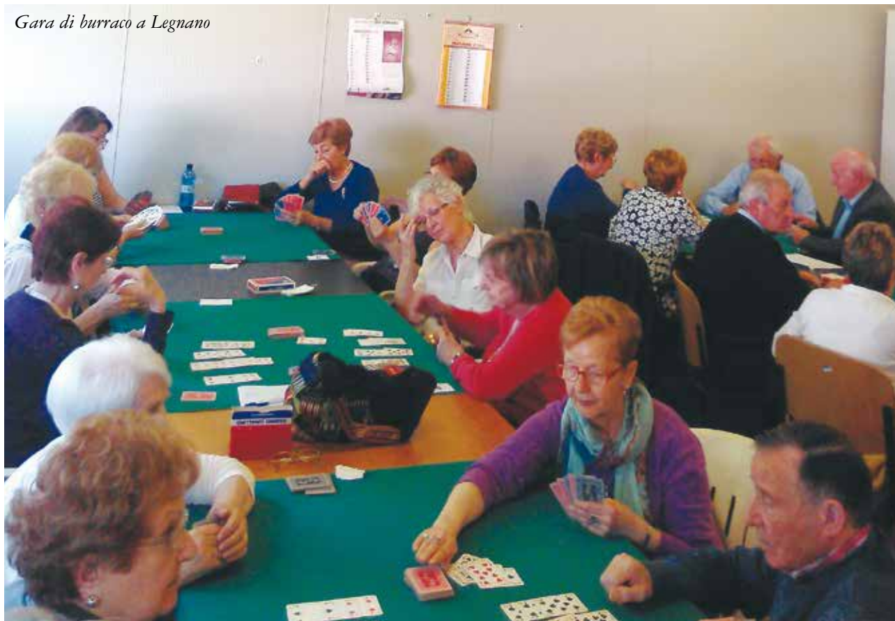
Gara di burraco a Legnano