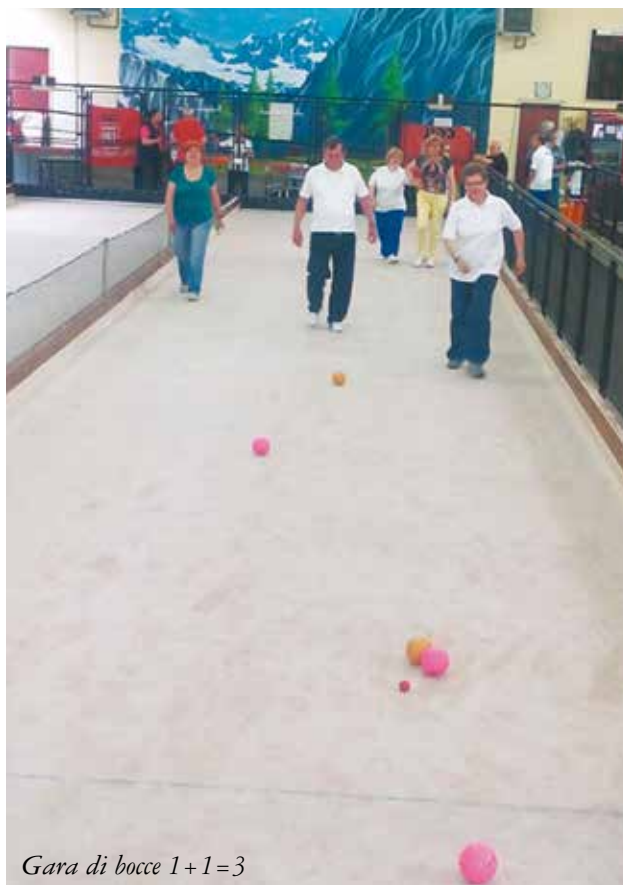
Gara di bocce 1+1=3

Un'idea partita dal nostro comprensorio. Abbiamo iniziato con organizzare una partita di bocce con ragazzi disabili nel 2009 con alcune associazioni di Legnano, è stata poi chiamata 1+1=3 ed estesa anche agli altri comprensori della Lombardia. Partecipano circa venti ragazzi disabili che si ritrovano tutte le domeniche al Bocciodromo di Nerviano. Un momento importante di coesione sociale. Da quest'anno abbiamo introdotto una novità. Abbiamo raccolto