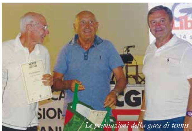
Le premiazioni della gara di tennis

presentazione teatrale, frutto del lavoro, di quelle associazioni che si impegnano ogni giorno per abbattere il muro degli handicap, a partire dal muro mentale che ancora persiste.