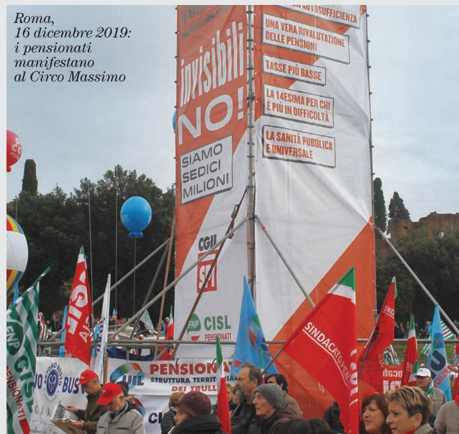
Roma, 16 dicembre 2019: i pensionati manifestano al Circo Massimo

La pandemia ha reso evidente la fragilità della condizione de-