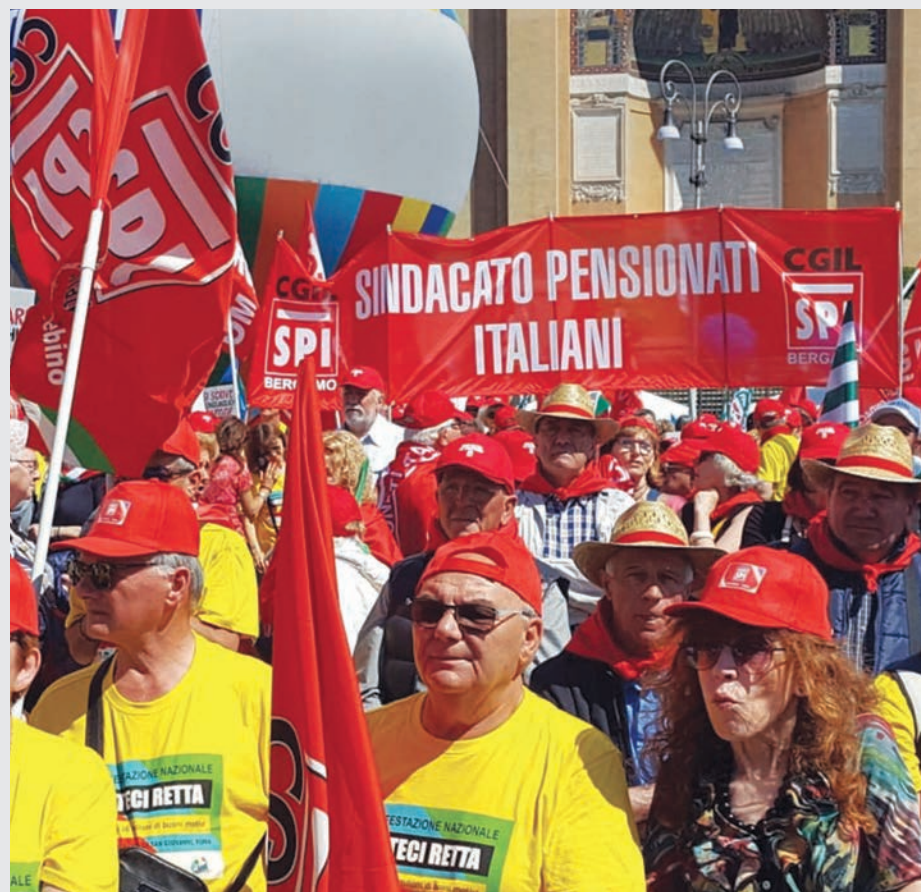
La manifestazione del 1° giugno 2019 in piazza San Giovanni a Roma

Va riconosciuto al Governo che nella legge di bilancio 2020 ha interrotto il trend di definanziamento e che, sotto l'incalzare dell'emergenza, è finalmente tornato a investire sul sistema sanitario e sui servizi territoriali.